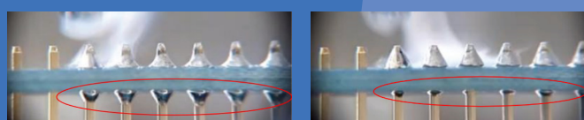
Almit DB-1 RMA LFM-48 M